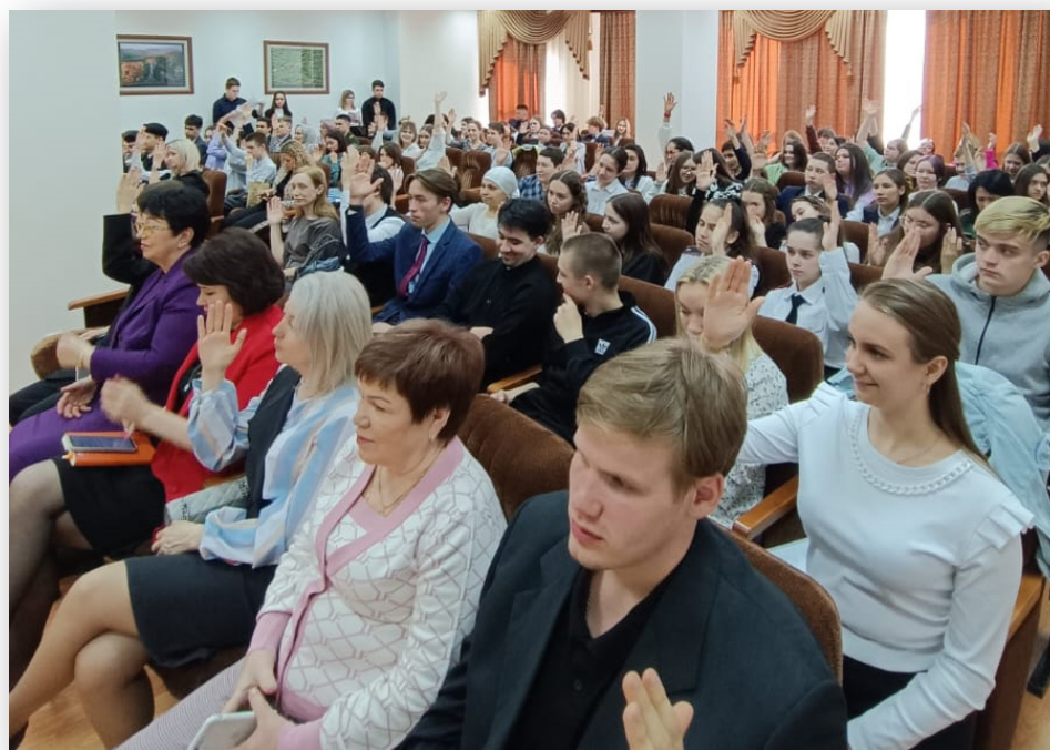
Голосование по вопросам, входящим в повестку Учредительного собрания членов Клуба молодых избирателей НМР РТ