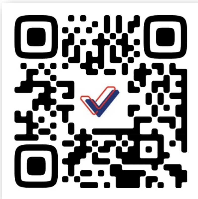
Фото 6. Страница Клуба молодых избирателей Нижнекамского муниципального района Республики Татарстан в социальной сети «ВКонтакте»