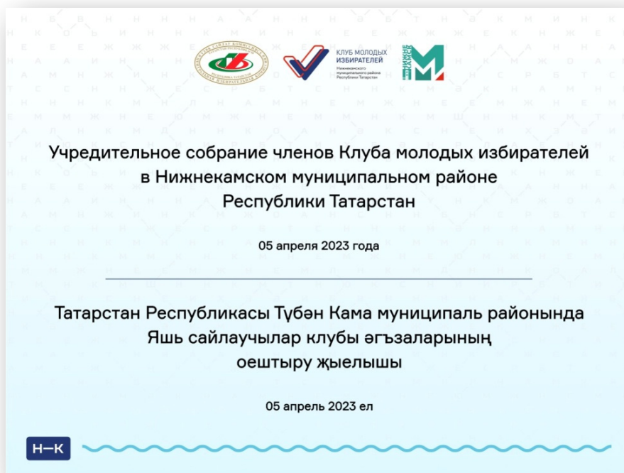
Презентация Клуба молодых избирателей Нижнекамского района Республики Татарстан