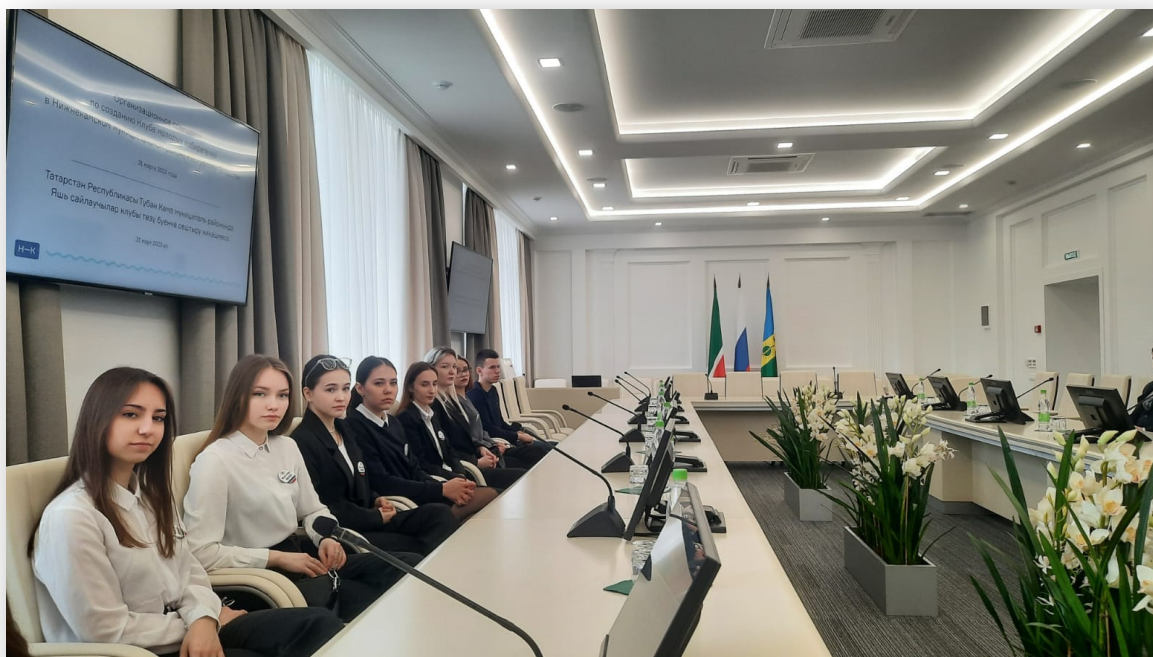
Презентация Клуба молодых избирателей Нижнекамского района Республики Татарстан. Студенты Нижнекамского филиала Казанского инновационного университета имени В.Г. Тимирязова