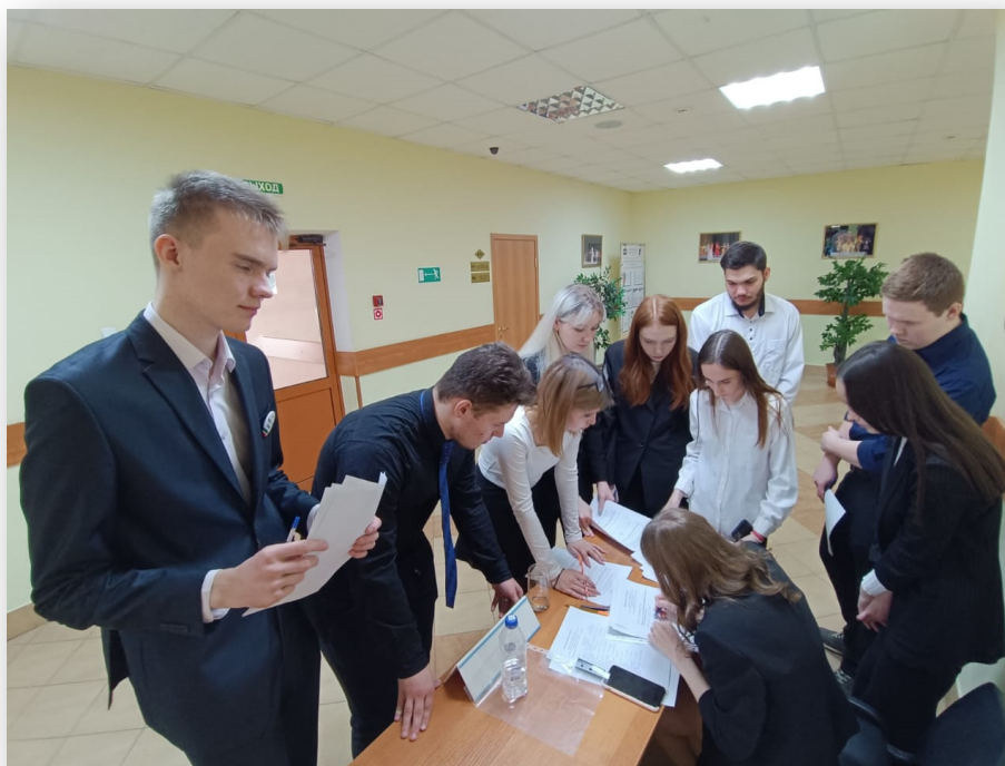
Работа Счетной комиссии Учредительного собрания членов Клуба молодых избирателей НМР РТ