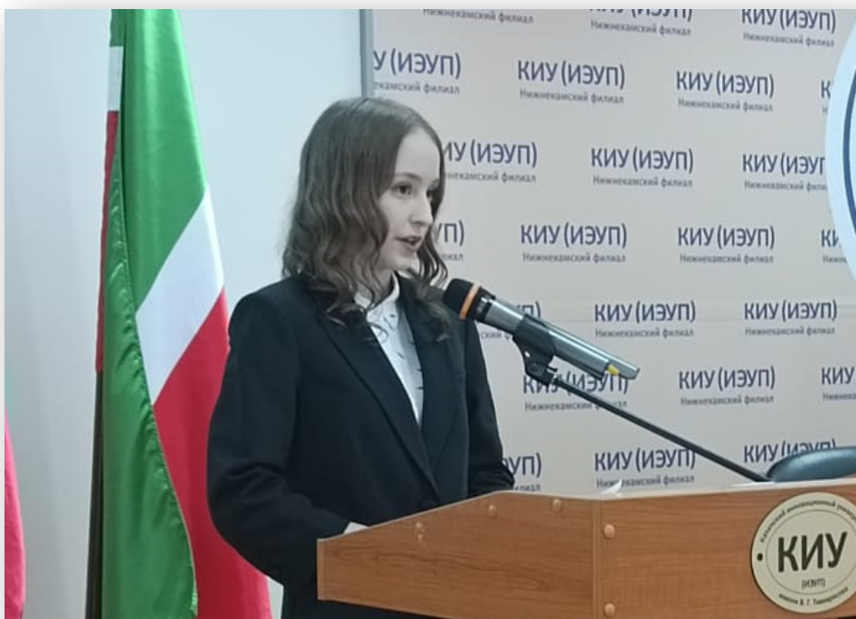
Голосование по вопросам, входящим в повестку Учредительного собрания членов Клуба молодых избирателей НМР РТ