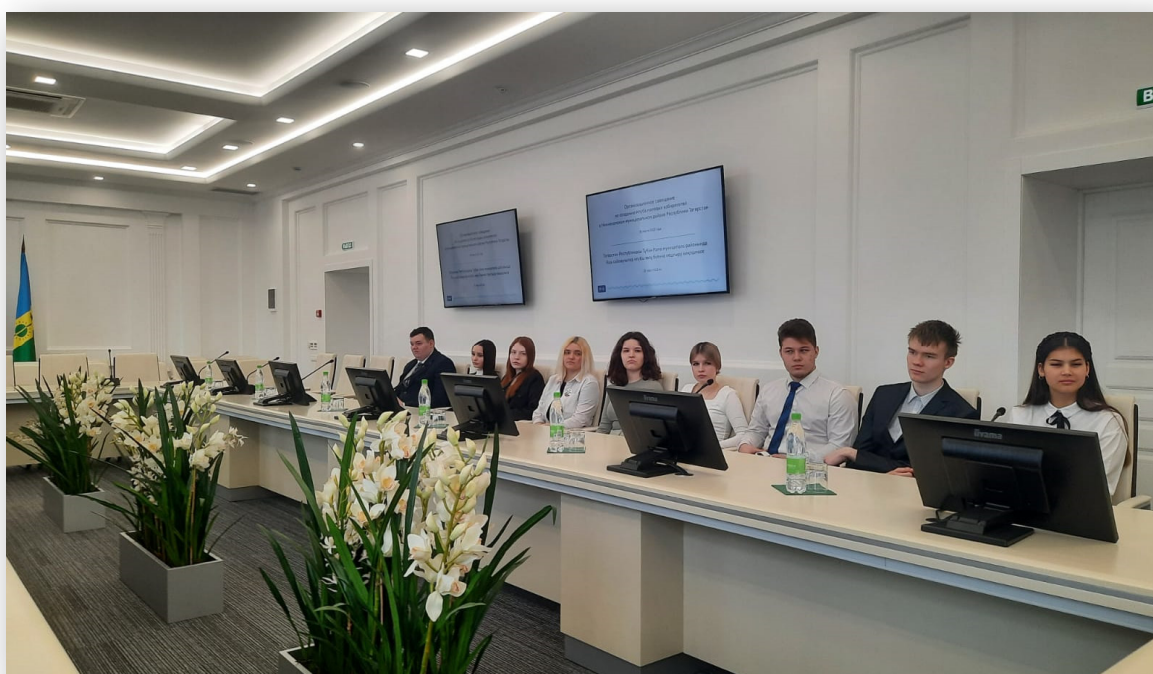
Презентация Клуба молодых избирателей Нижнекамского района Республики Татарстан. Студенты Нижнекамского филиала Казанского инновационного университета имени В.Г. Тимирязова