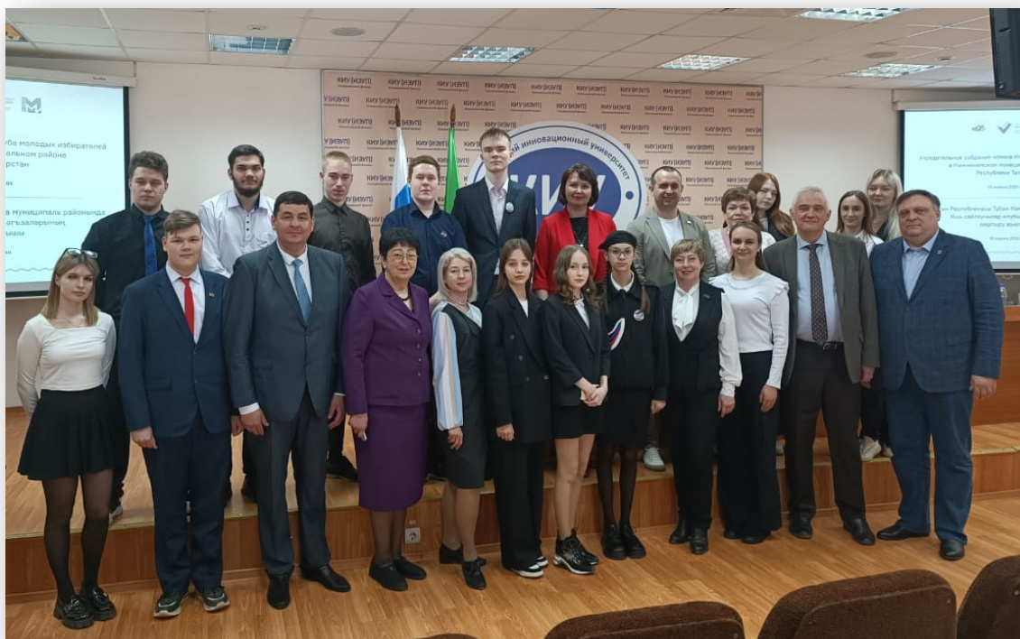
Члены Клуба молодых избирателей Нижнекамского муниципального района Республики Татарстан и почетные гости Учредительного собрания Клуба молодых избирателей Нижнекамского муниципального района Республики Татарстан